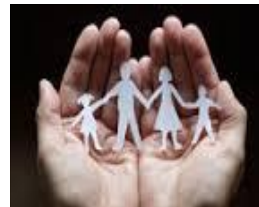
Linguagem de sinais